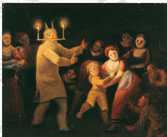
Peder Madsen Faxøes maleri Julebisp eller Mand der agerer julebuk fra ca. 1825. Nationalmuseet

Under sangen ofrede alle, en efter en, nødder og æbler. Når julebispen ikke var tilfreds med sit offer, tog han kar-kludden, dyppede den i skålen og kastede den i ansigtet på de, der ikke havde ofret nok.