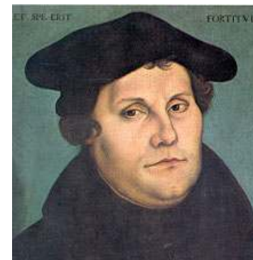
Martin Luther startede reformationen i kirken. Han skrev 95 teser (ting han var utilfreds med i kirken), som han hang op på en kirkedør i Tyskland i år 1517.

Allehelgen er den dag på året, hvor man fejrer alle de kristne helgener. Mange helgener har en dag, hvor de bliver fejret, men der er mange flere helgener, end der er dage på et år. Derfor kunne de ikke alle sammen få deres egen dag. Så alle de helgener, der ikke har en dag i kalenderen, fejrer man på allehelgensdag. Dagen efter allehelgensdag er det alle sjæles dag, hvor man skal huske på alle dem, der er døde.