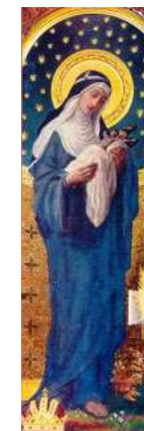
En helgen som har været populær i Danmark er Birgitta af Vadstena. Hun var en adelsfrue, der var gift og havde børn. Alligevel besluttede hun at gå i kloster. Her fik hun åbenbaringer fra Gud, som hun skrev ned. Hun mente altså, at Gud talte til hende.

En helgen er en mand eller kvinde, som har gjort nogle særligt gode ting i deres liv, eller som har været meget fromme (troet meget på gud) og derfor er blevet gjort hellige af kirken. Som regel efter deres død.