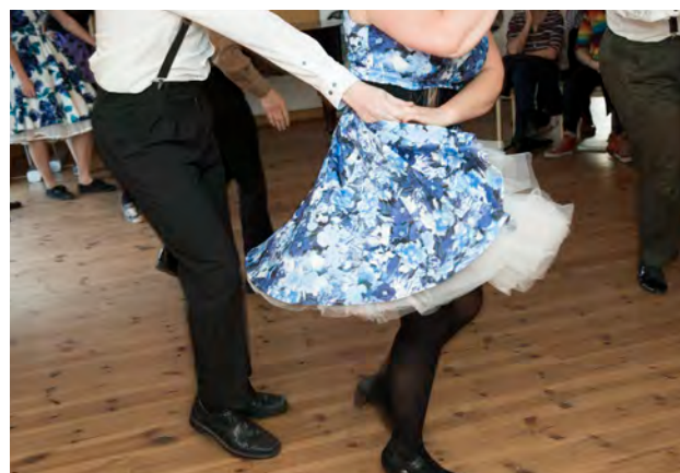
Der var godt med sus i skorterne, da DTU Dancing satte gang i dansegulvet i marts.

Igennem sang, musik og fortælling tager vi deltagerne med på en tur down memory lane til Danmark i