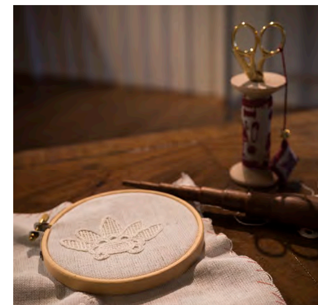
En blomst i teknikken hvidsøm tager form i broderirammen.

I løbet af udstillingsperioden stillede flere af udstillerne op til arrangementer, hvor gæsterne selv kunne prøve kræfter med broderiet, og i samarbejde med tekstil-