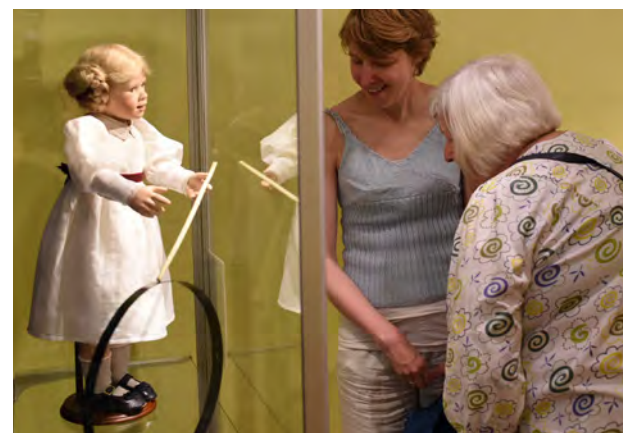
Gæster i udstillingen beundrer dukken, som er klædt i en kjole af hør, dekoreret med hedeboosyninger.