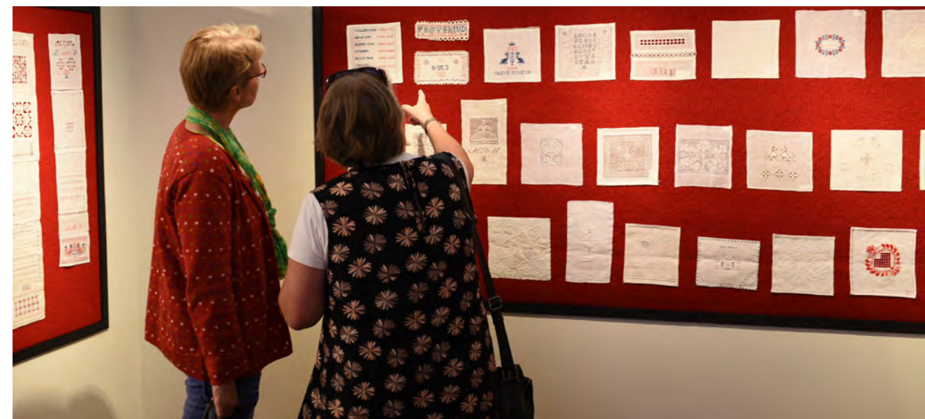
Mange af de nye broderier blev syet som såkaldte "prøveklude". Her er de samlet og vist i udstillingen.

Hedeboosyning er fællesbetegnelsen for syv forskellige broderivariationer, der blev udviklet fortløbende og anvendt sideløbende i en periode fra slutningen af 1700-tallet til midten af 1900-tallet på hedeboegnen, som Greve er en del af. Frem til 1870 var der tale om bondesyninger, som en stor del af kvinder fra området mellem København, Roskilde og Køge var i stand til selv at udføre. Efter 1870 syede de dygtigste bondekvinder hedeboosyning, som blev købt af velhavende københavnske kvinder. I starten af 1900-tallet kom det på mode, at borgerskabets kvinder selv lærte at sy varianter af hedeboosyning. Det var på dette tidspunkt, at hedeboosyning blev syet over hele Danmark og kopieret og solgt i bl.a. England og USA.