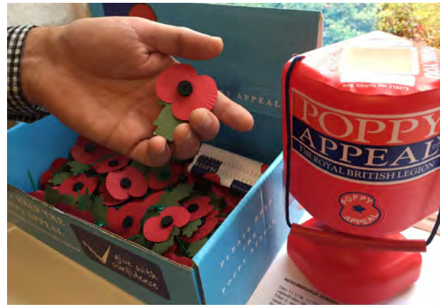
Collection pot. Markeringen af den britiske Remembrance Sunday med røde valmuer blev atter fulgt af foredrag på fortet.