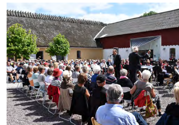
De mange fremmødte gæster kunne nyde musikken, sangen og det gode vejr ved årets midsommerkoncert.

Tag med på byvandring i Greve Landsby sammen med