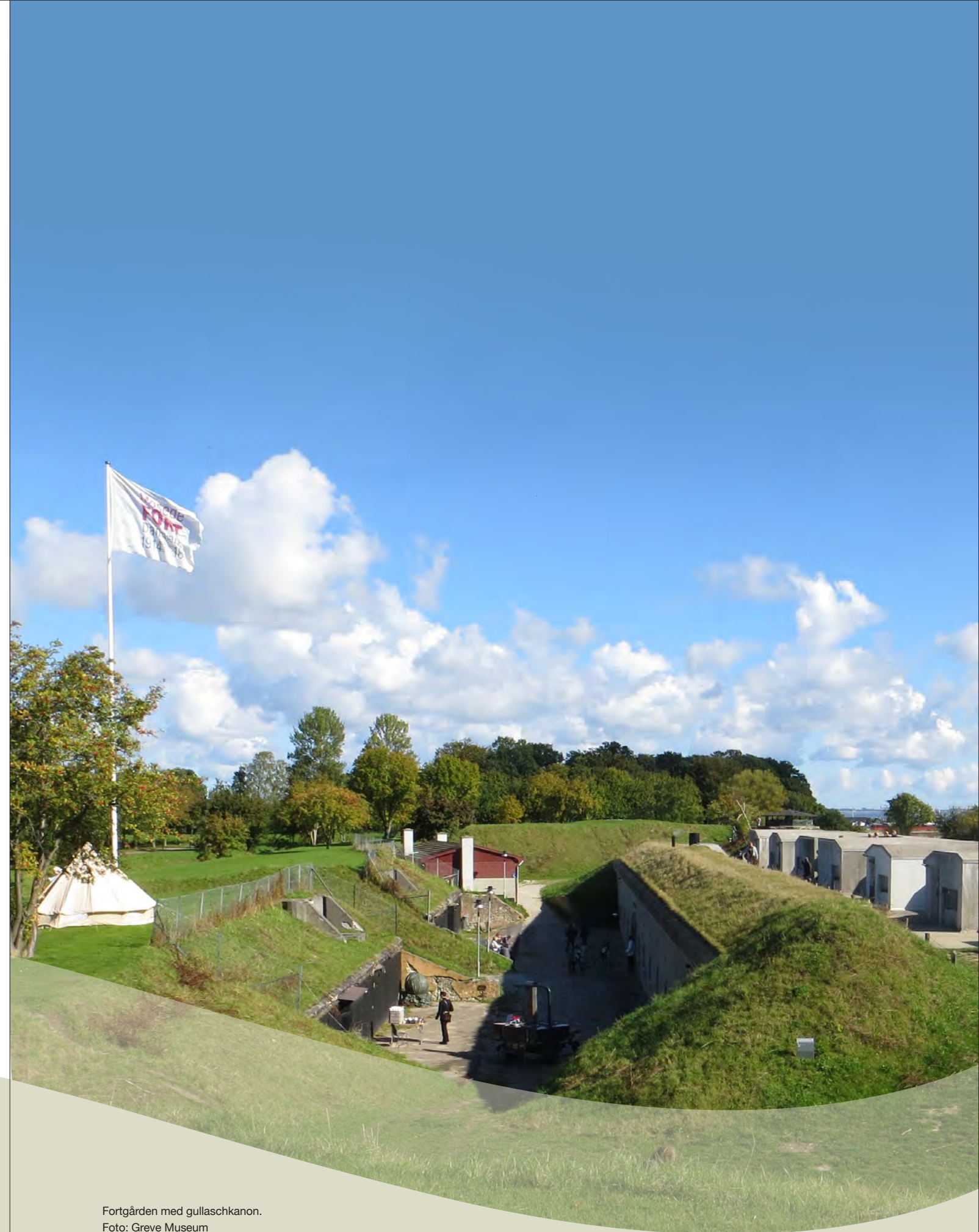
Fortgården med gullaschkanon.