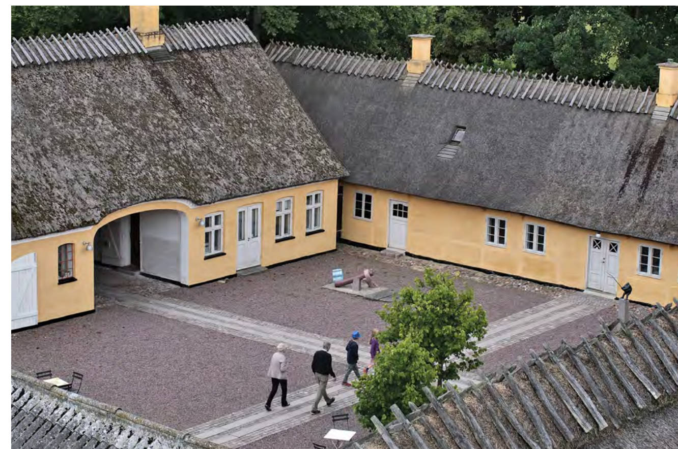
Gæster på vej over til stuehuset.

Appen Danmarks Museer med historier fra stuehusets udstillinger er nu udvidet med flere historier, og det er muligt at låne en iPad med indholdet, så det ikke er nødvendigt at downloade appen til egen telefon.