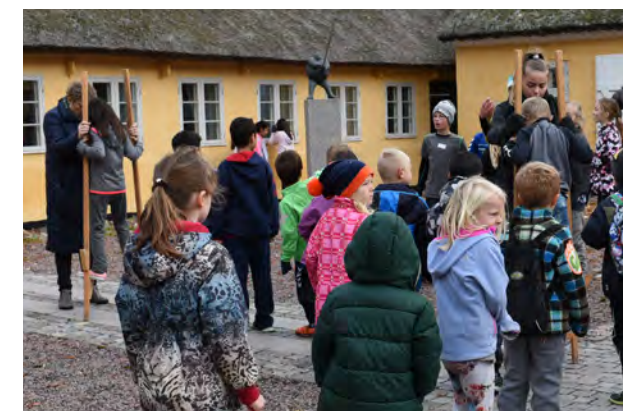
Rigtig mange skolebørn besøger museet i løbet af året. Her prøver de kræfter med stylvter i gården.

På Mosede Fort – Danmark 1914-18 fordeler gæsterne sig på individuelle besøgende, hvoraf mange deltager i den offentlige omvisning, der er en del af billetten. Mange foreninger og organisationer har i 2016 bestilt en privat omvisning.