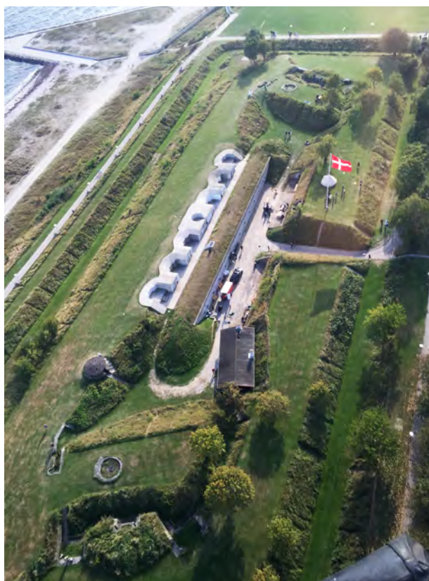
Luftfoto taget fra helikopter på Befæstningens Dag.

Natten mellem lørdag og søndag den 27. marts er det tid til endnu engang at stille uret en time frem, når det bliver sommertid. Det har vi nu gjort hvert eneste år siden 1980, men faktisk er sommertid i Danmark 100 år