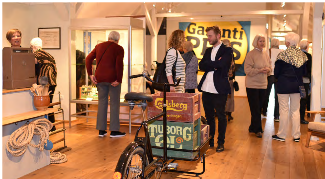
Udstillingen forsøgte at gengive noget af den stemning, der eksisterede blandt købmændene på landet.

Mulighederne for indkøb af dagligvarer har aldrig været mere varierede, og kampen om kundernes loyalitet er blevet mere intens. Kundernes valg af indkøbssted afhænger af pris, bekvemmelighed, vareudvalg, kvalitet, beliggenhed og serviceniveau. Sådan har det ikke altid været. Tidligere var indkøbsmulighederne begrænset til nærområdets små butikker. Det betød ikke, at alle købte ind det samme sted. De enkelte befolkningsgrupper var ofte loyale overfor enten den lokale købmand, den nærmeste høker eller landsbyens brugsforening. Udstillingen viste udviklingen i handelsmønstre over tid