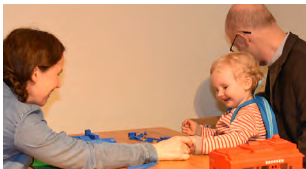
Børn og barnlige sjæle kunne bygge deres egen brugsførelse i Lego i udstillingen.

nye kæder ved hjælp af anderledes reklame, indretning og personligt nærvær.