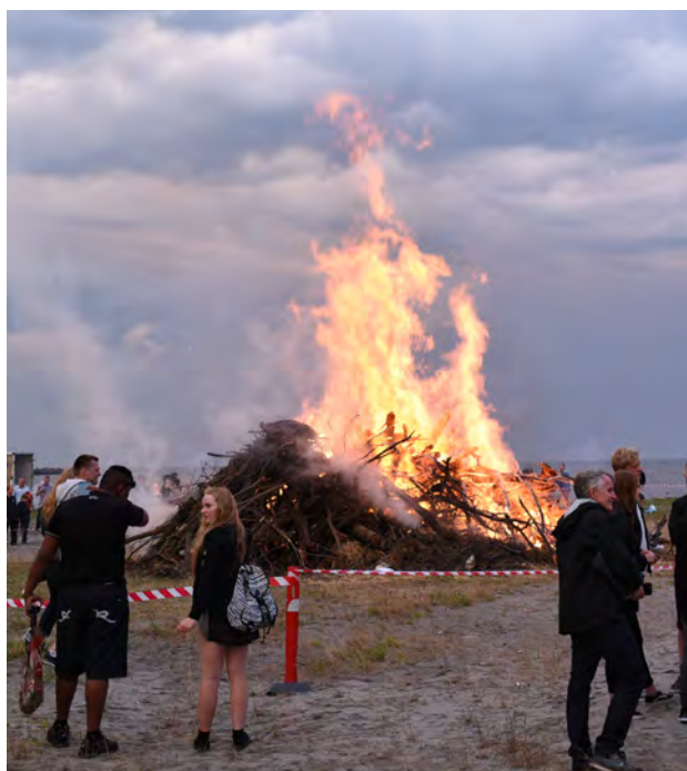
Ild i bålet kom der, men resten af aftenen druknede i regn.

På Mosede Fort – Danmark 1914-18 var der denne aften et mylder af mennesker, indtil vejrguderne ville det anderledes. Pludselig kom der skybrud, så de fleste