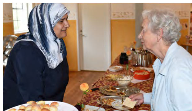
Samtale over det lækre kagebord ved arrangementet Den store bagedag.

Elsker du kage? Og er du god til at bage? Så medbring din favoritkage til den store bagedag på Greve Museum. Gratis for deltagere, der medbringer eget bagværk.