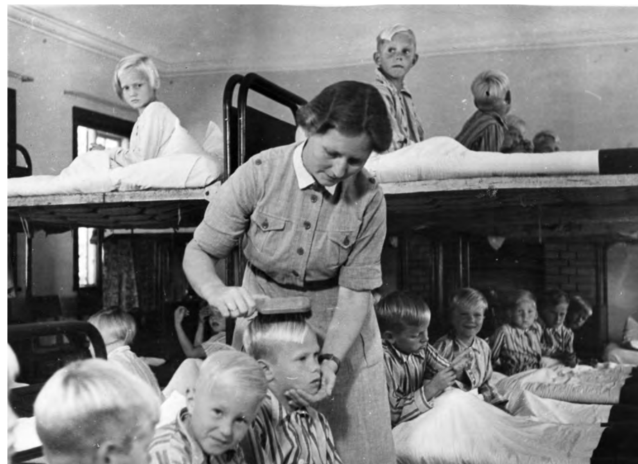
Finnebørnene i sovesalen på Villa Olsbæk. Kvinden, der redder hår, er en af de finske lotter, der fulgte med børnene. Optaget 1941-43

En af de mere specielle indkomster stammer også fra området ved stranden og blev indleveret i forbindelse med arkivets deltagelse i Kulturarvskommuneprojektet.