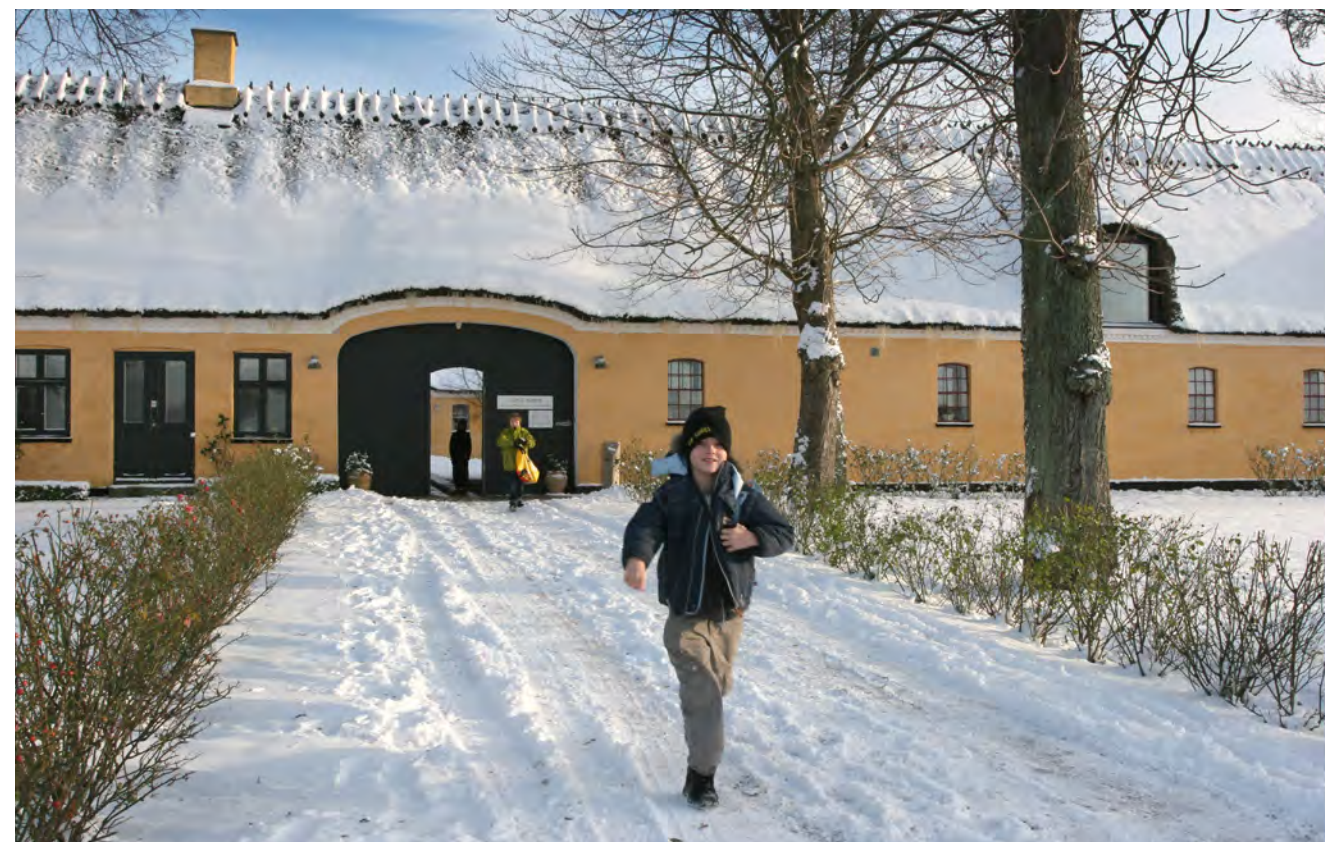
Når Grevegården dækkes af sne, inviterer det til aktivitet og bevægelse for børn og barnlige sjæle.

Syng med på både nye og gamle sange, når der er "fællessang i forsamlingshuset". I caféen sælges der i dagens anledning lagkage i pausen.