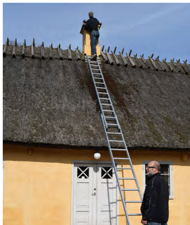
Allikerne skal gerne holdes væk fra museets skorsten.