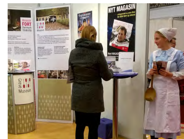
På Boligdage i Greve Idrætscenter var der god mulighed for at få en snak med de mange gæster.