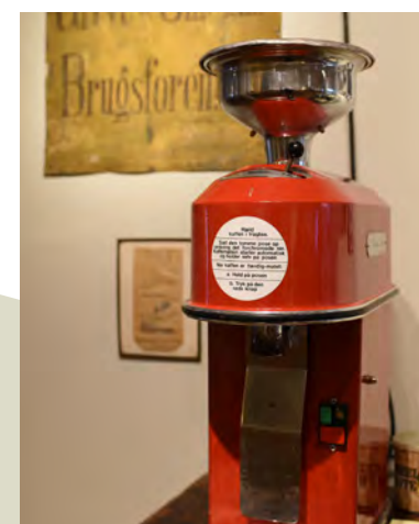
I udstillingen kunne publikum male kaffebønner på Greve Brugsforenings gamle kaffemølle.