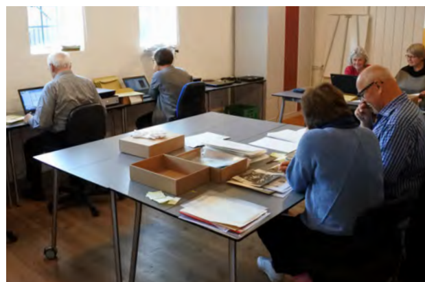
De frivillige arbejder hårdt på arkivet.

I 2016 har vi haft et meget nært samarbejde med Greve Lokalhistoriske Forening (GLF) og Sydkystens Slægtsforskere, ligesom vi også har indledt et tættere samarbej-