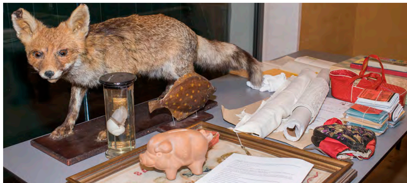
Et lille udvalg af nogle af de genstande, som museet tog imod i 2016.