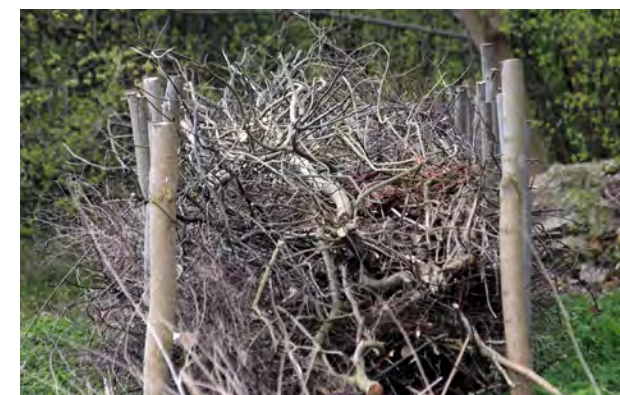
Faskinehegnet med indhold.

I jernalderen var gårdene helt eller delvist indhegnet og ofte til dels af et faskinehegn. I trærige dele af landet kunne det indgå i indhegningen af haver og i det åbne land i hegn til dyrefolde, ligesom det var en almindelig hegnstype i skovene. Med tiden gik denne, og andre ældre hegnstyper, mere eller mindre af brug, men efter de-