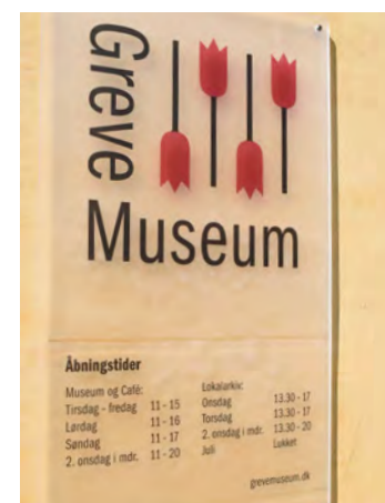
Grevegård har i 2016 fået nye skilte.