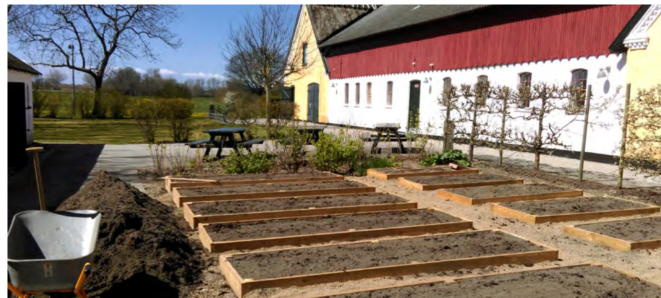
De nye højbede med jomfruelig, ukrudtsfri muldjord.

Mosede Fort – Danmark 1914-18 høster megen anerkendelse. I 2016 blev museet på Mosede Fort nomineret til den internationale Micheletti Award. På en konference i maj måned på Lesbos blev det afsløret, hvem der løb af med prisen. Det blev Danmark – nærmere betegnet